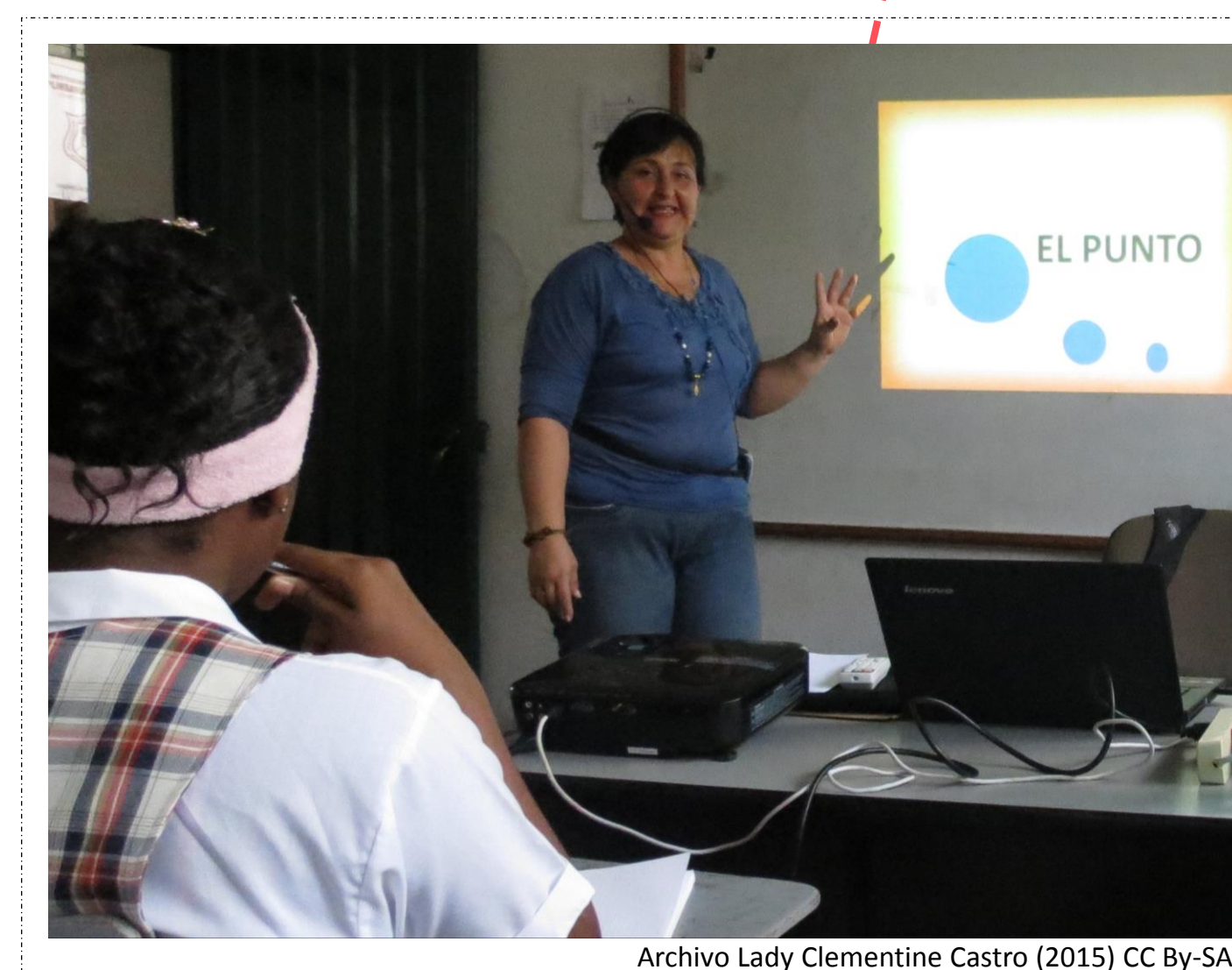
Archivo Lady Clementine Castro (2015) CC BY-SA